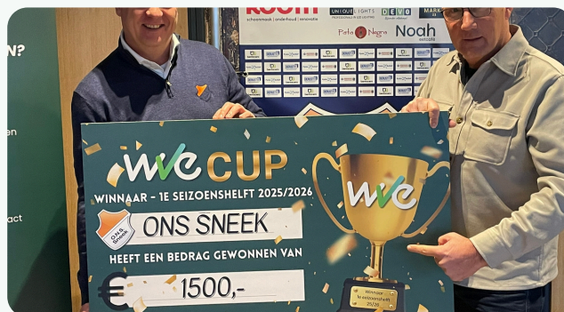
WVE Cup-uitreiking – O.N.S. Sneek ontvangt de cheque van € 1.500

Dit is de stand na periode 1. De winnaar van periode 2 én de totaalwinnaar maken we bekend in de juli-editie.